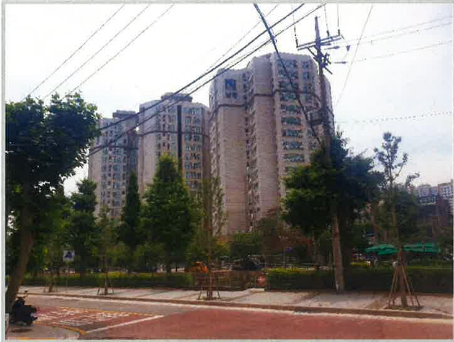
【 본건전경 】