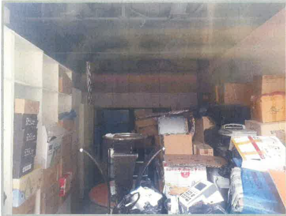
【 본건내부 】