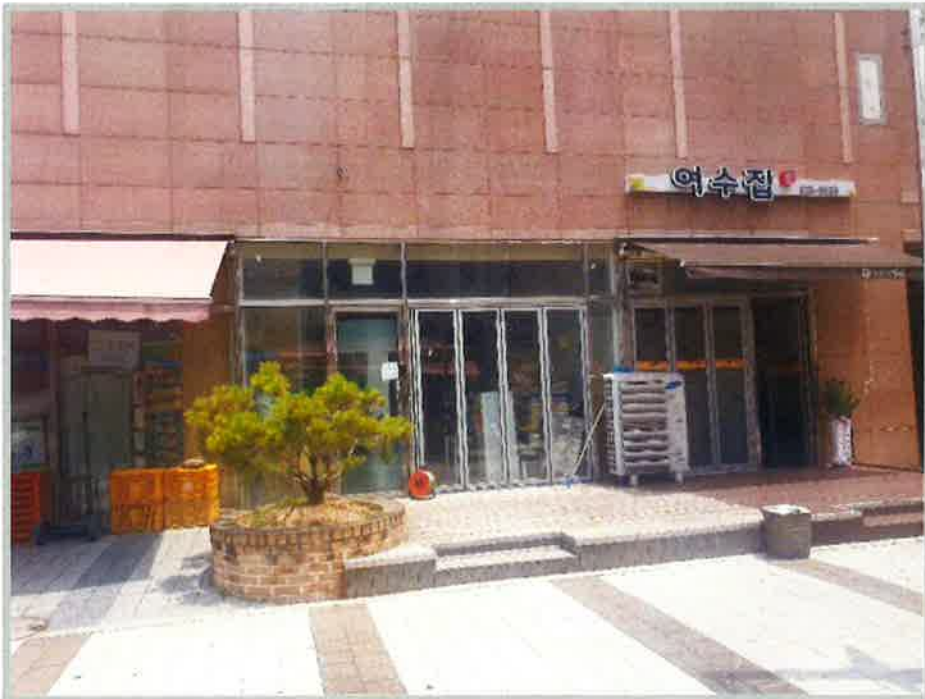
【 본건전경 】