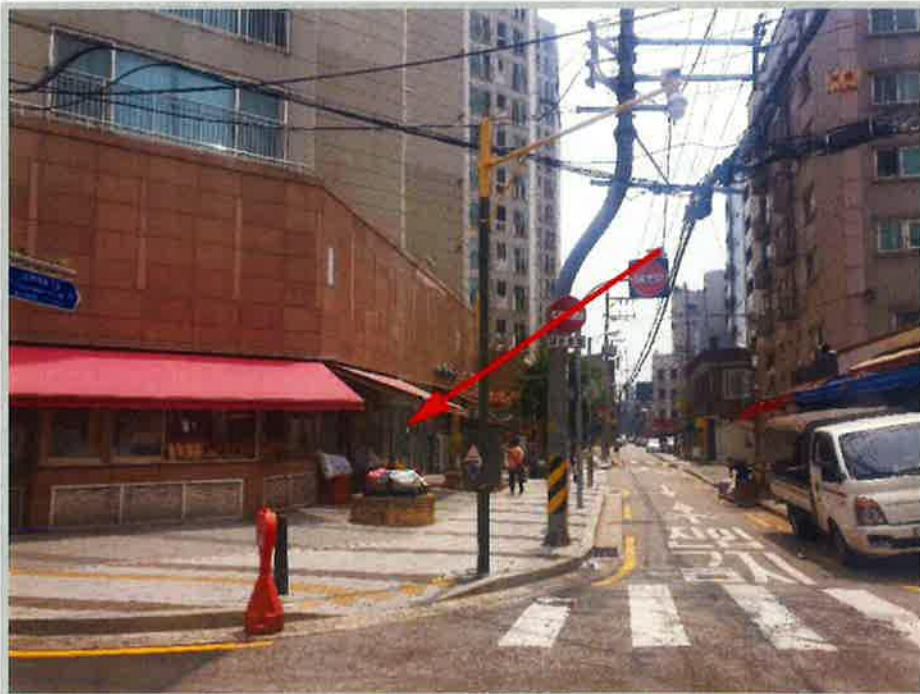
【 본건및주위환경 】